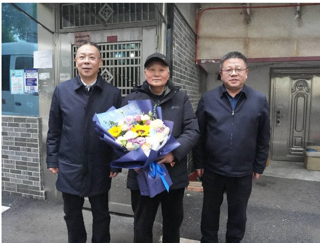
校党委书记、校长慰问民主党派成员

新春送祝福，岁寒暖人心。为深入贯彻落实习近平总书记关于做好新时代党的统一战线工作的重要思想，紧密对接湖南省高校统一战线“四同四立”（同心同德、同向同行、立己立人、立功立言）主题活动部署，南华大学党委精心组织开展了走访慰问活动。学校党委高度重视，党委书记、校长率先垂范，深入慰问民主党派代表人士；校党委委员、副校长、统战部部长带队走访，形成了校领导班子成员齐抓共管、共同参与的良好局面，将党委的关怀与温暖精准送达广大统一战线成员心中。