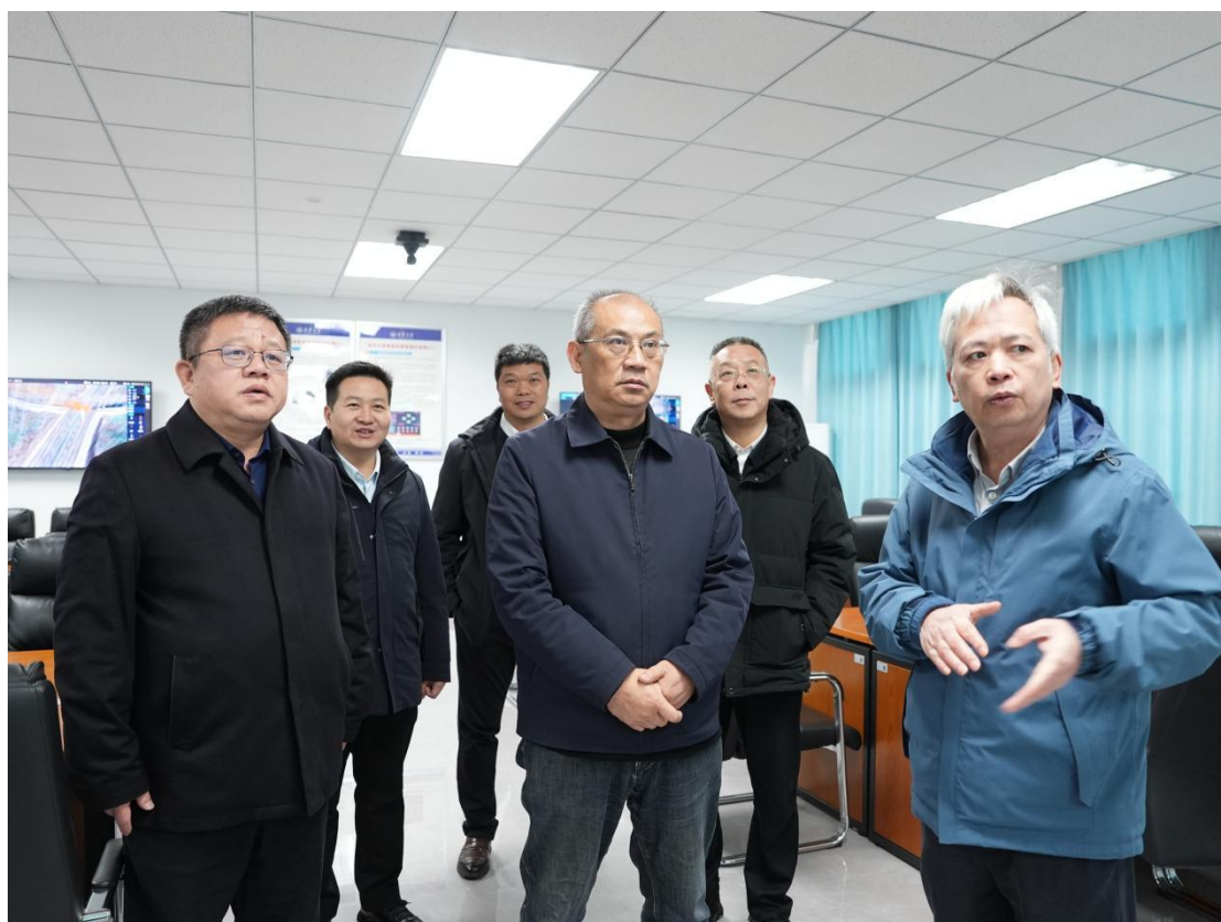
潘碧灵在核学楼调研

1月20日上午，省政协副主席、民进湖南省委会主委潘碧灵一行到南华大学，专题调研民进基层组织建设。南华大学党委书记唐忠阳、校长夏昆，副校长周青芝、梁伟，衡阳市政协副主席、民进衡阳市委会主委陈淼参加。