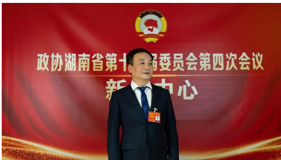
湖南省政协委员、南华大学附属第一医院副院长 谭钢