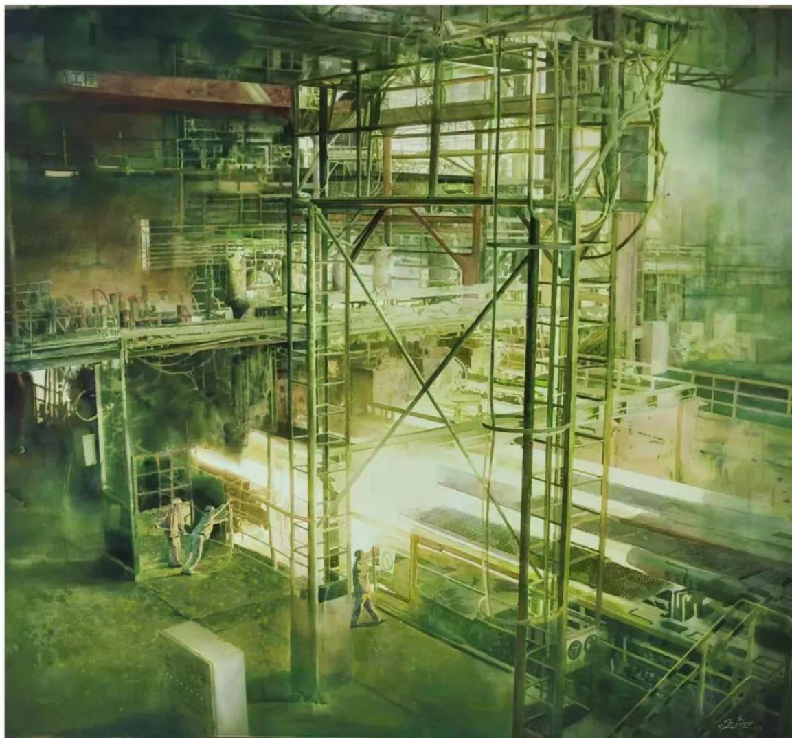
《百炼成钢》 唐国富 120×120cm 水彩