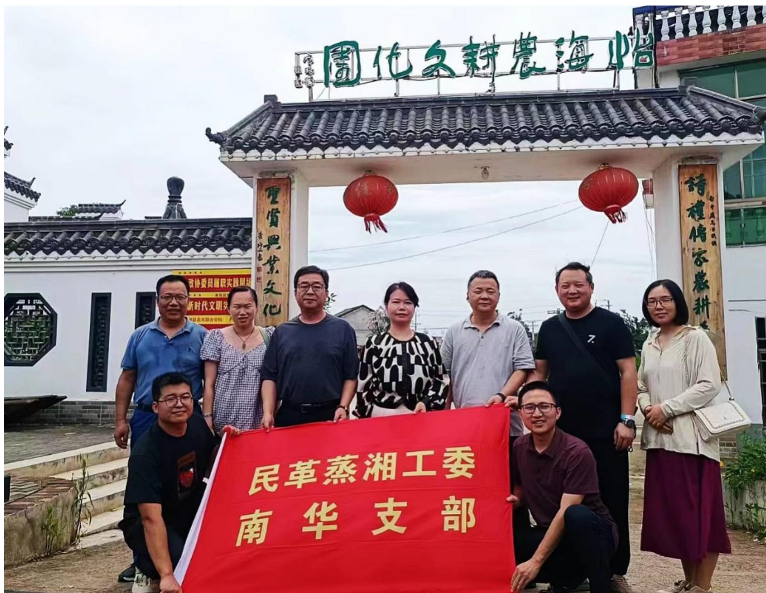
图：活动参与人员在怡海农耕文化园合影

已在推动乡村振兴中的责任和使命。党员们表示将更加积极参与到乡村振兴工作中，为构建美好乡村、实现农村富裕贡献自己的力量。（隋清霖，冯志刚）